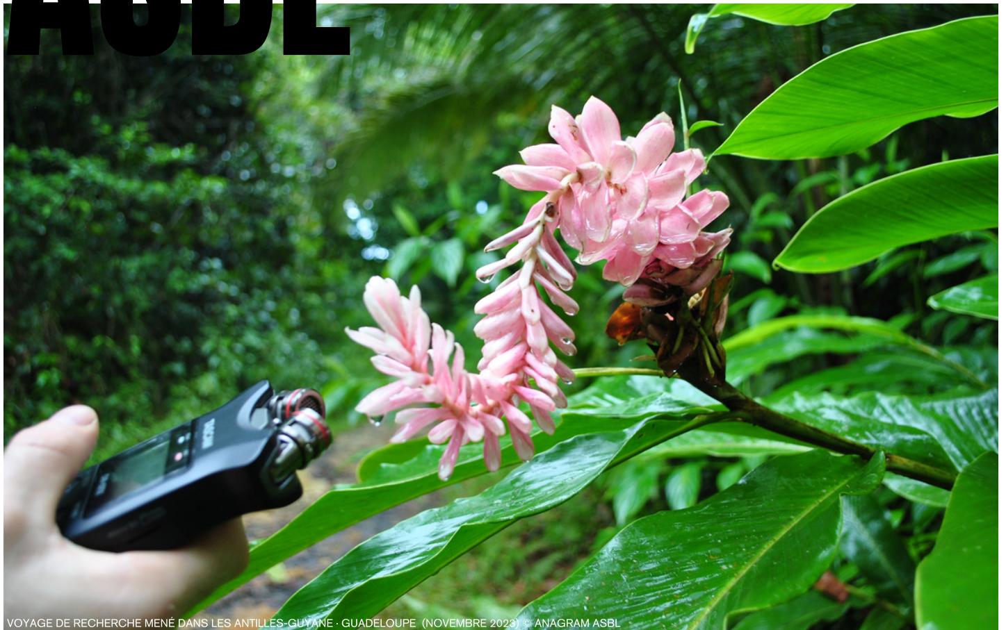
VOYAGE DE RECHERCHE MENÉ DANS LES ANTILLES-GUYANE - GUADELOUPE (NOVEMBRE 2023)

Anagram est une asbl basée à Bruxelles qui, au travers de manifestations culturelles et artistiques, vise à proposer des réflexions sur des problématiques écologiques et sociales. Anagram se distingue par sa vision novatrice où l'artiste est un vecteur de diffusion unique faisant dialoguer l'acte artistique dans un contexte de mise en valeur du Vivant. La transdisciplinarité est une approche fondamentale dans l'élaboration des projets menés par l'asbl.