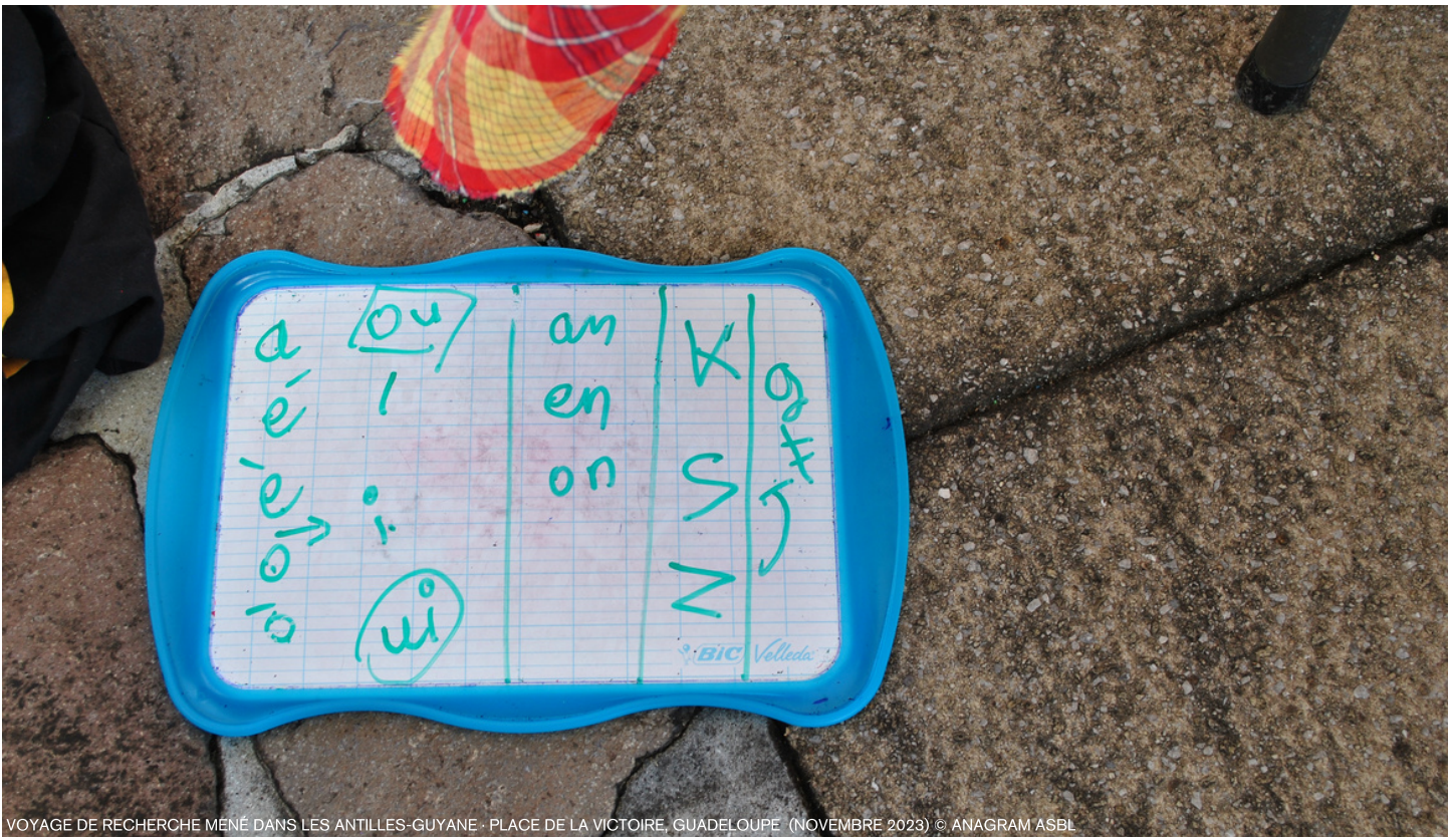
VOYAGE DE RECHERCHE MENÉ DANS LES ANTILLES-GUYANE - PLACE DE LA VICTOIRE, GUADELOUPE (NOVEMBRE 2023)