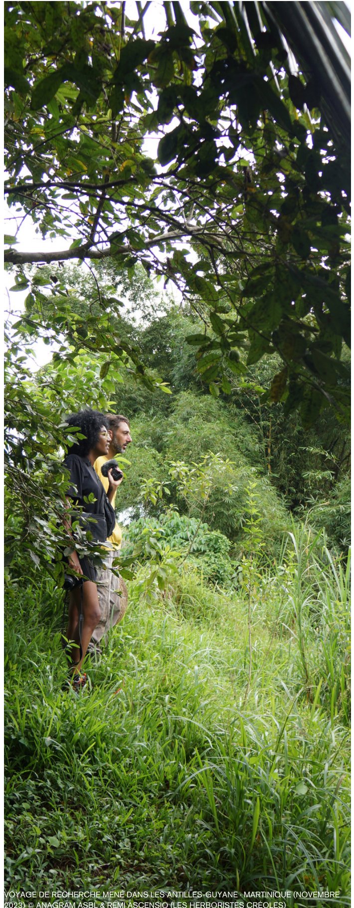
VOYAGE DE RECHERCHE MENÉ DANS LES ANTILLES-GUYANE - MARTINIQUE (NOVEMBRE 2023)