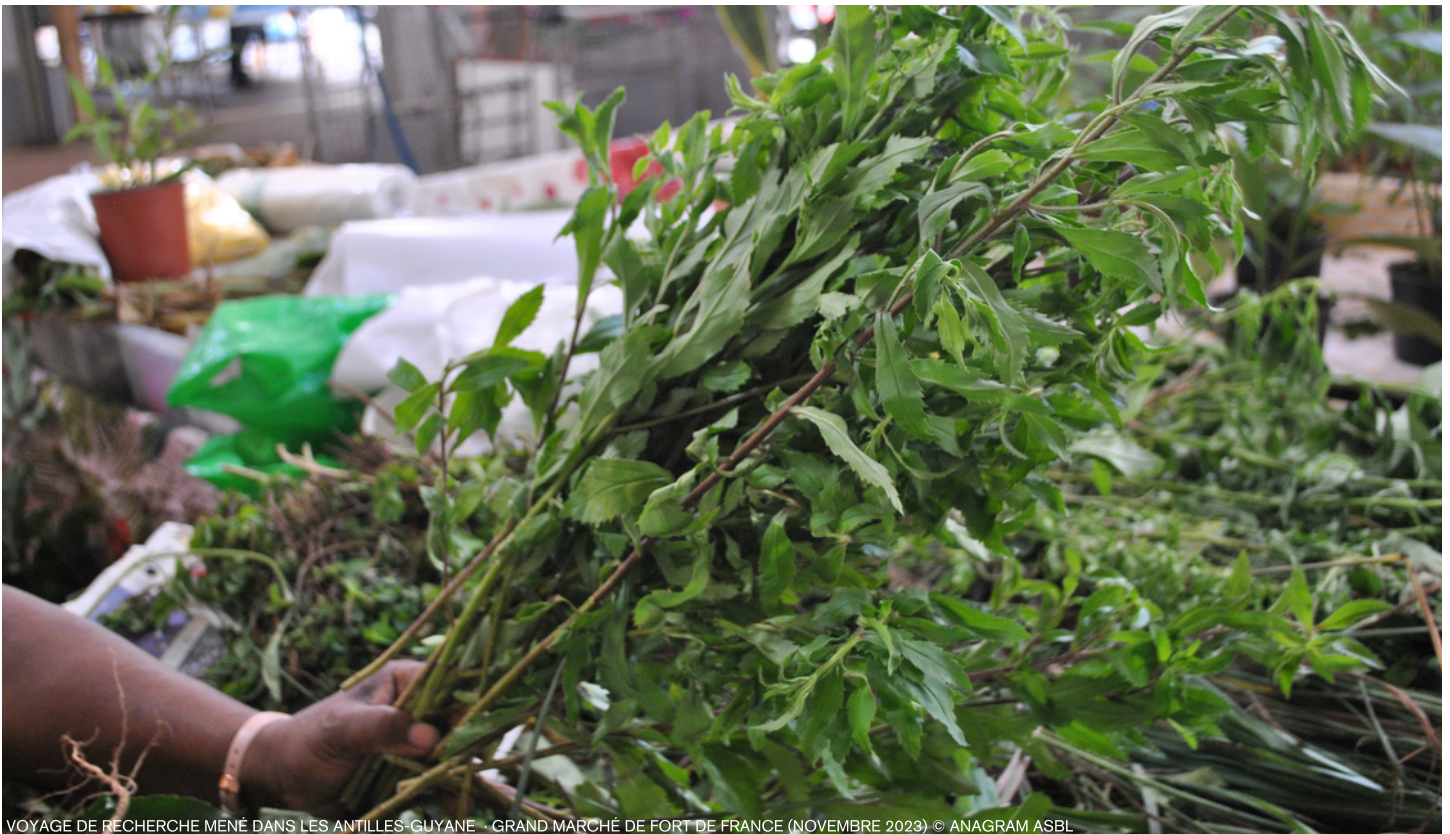
VOYAGE DE RECHERCHE MENÉ DANS LES ANTILLES-GUYANE - GRAND MARCHÉ DE FORT DE FRANCE (NOVEMBRE 2023)

Tout est parti d'un livre d'un chercheur et historien fabuleux, celui de Samir Boumediene, La Colonisation des savoirs : une histoire des plantes médicinales du « Nouveau Monde » (1492-1750) qui met en parallèle la conquête des plantes médicinales avec l'histoire coloniale. Car oui, le savoir a toujours été lié au pouvoir. Depuis le XVIIIe siècle, toute université se devait de posséder son jardin botanique. La connaissance des plantes s'est aussi intimement développée autour de l'évolution socio-politique de nos sociétés modernes.